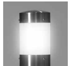
Edelstahl, Acrylglas matt