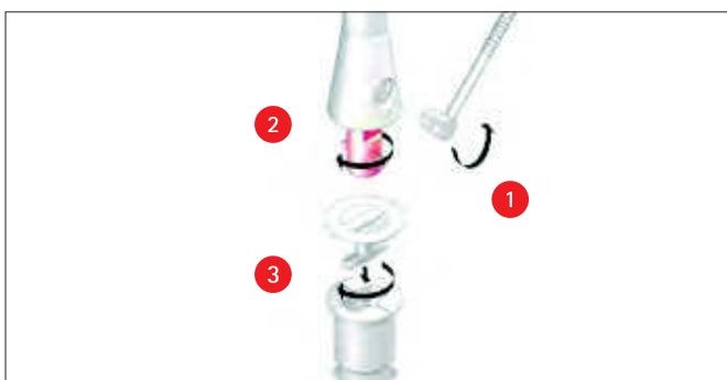
Der Poller kann so auch temporär entfernt werden.