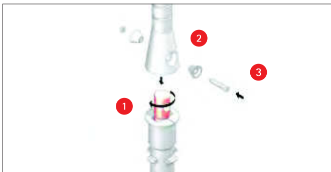
Das Verbindungsstück wird ausgetauscht.