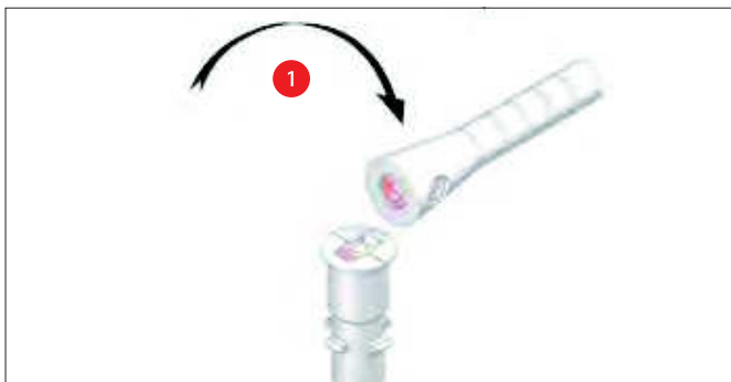
Das austauschbare Verbindungsstück bricht an der Sollbruchstelle.