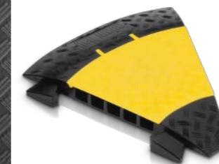
Art. Nr. 13839