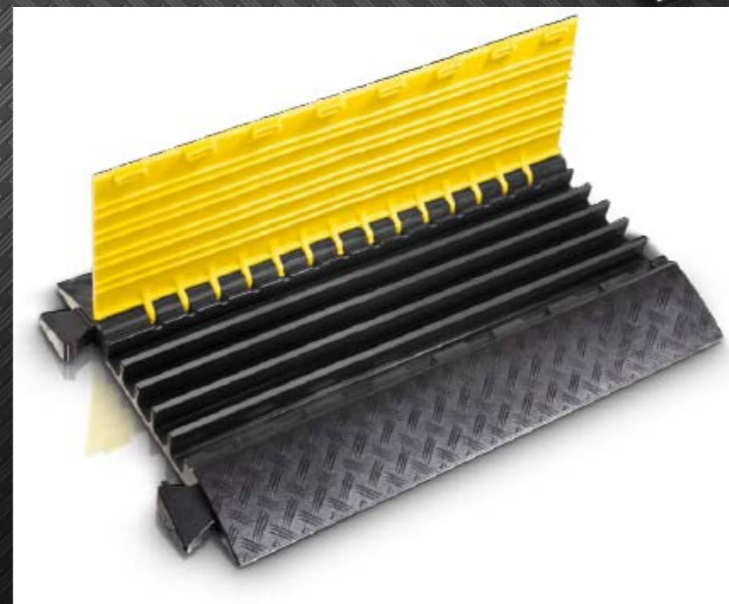
Art. Nr. 13840